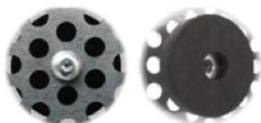
Fissaggio su lamiera

Magneti rivestiti in gomma disponibili da 12 mm a 88 mm con forza magnetica da 10N a 420N. Hanno un filetto che permette di fissare il magnete sulla lamiera con vite oppure creare un aggancio personalizzato.